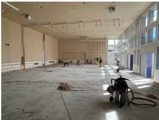
Sanierung Turnhalle Widem Stand der Sanierungsarbeiten

Aus dem Gemeinderat möchten wir Sie über einen weiteren Nachtragskredit von 57'000 Franken informieren, welcher jedoch nicht ganz mit dem anfänglichen Projekt der Turnhallensanierung in Verbindung steht, aber es trotzdem Sinn macht, diese Sanierung zeitgleich umzusetzen. Es betrifft die Heizungssteuerung der Heizkreise im übrigen Schulhaustrakt inkl. der Erweiterung Süd und dem Verwaltungsgebäude. Im Rahmen der Turnhallensanierungsarbeiten wurde die Regelung für die Heizung der vorgängig erwähnten Gebäudeteile genauer überprüft. Dabei ist festgestellt worden, dass diese Heizungsregulierung veraltet ist und das zum Teil Baugruppen defekt sind. Es würde Sinn machen, diese gelegentlich zu sanieren und auf einen technisch aktuellen Stand zu bringen.