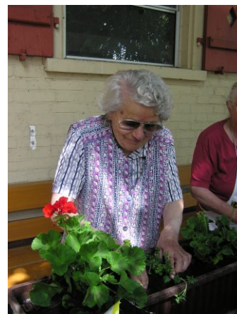
Bilder von Mai 2008

Ausgabe: 6 x jährlich Herausgeber: Alterswohnheim „Möösl“ Redaktion: Rita Flühler Gestaltung und Druck: Steffi Lüchinger / Markus Lenherr