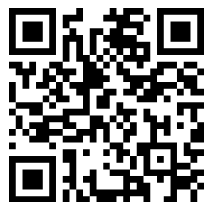
QR-Code zur Umfrage

Was sind Ihre Ansprüche an den künftigen Wohn- und Lebensraum in der Gemeinde Gams? Wie soll sich Ihr Quartier entwickeln? Um diese Fragen zu beantworten und Ihre Meinung zum Raumkonzept in die weitere Erarbeitung der Instrumente der Ortsplanung mit einzubeziehen, wird eine Umfrage durchgeführt. Zum Ausfüllen der Umfrage sind alle Einwohnerinnen und Einwohner der Gemeinde Gams eingeladen. Den Link zur Umfrage finden Sie online auf unserer Homepage www.gams.ch oder direkt unter www.findmind.ch/c/raumkonzept . Selbstverständlich können die Umfrageunterlagen auch direkt bei der Gemeinde Gams bezogen bzw. angefordert werden.